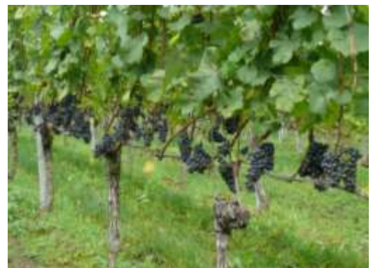
Abb. 3: In einer gut entblätternen und damit luftigen Traubenzone sind nachweislich weniger Kirschessigfliegen zu finden.