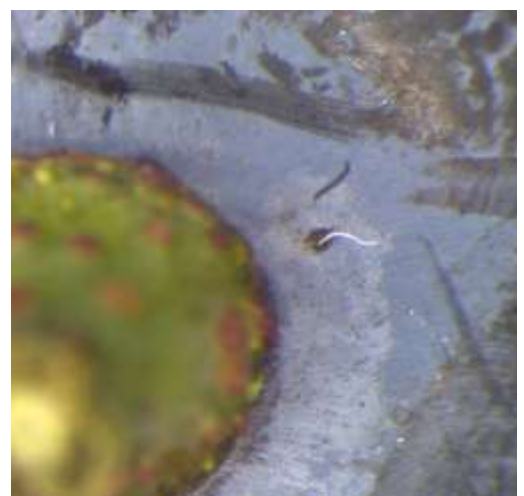
Abb. 5 oben: Probennahme für die Eiablage-Bonitur. Unten: Atemschläuche eines Eies in Stielnähe.