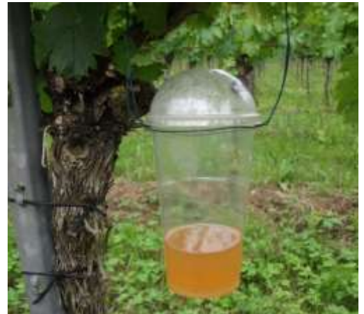
Abb. 4: Standardfalle mit Apfelessig-Wasser-Gemisch für das Fallenmonitoring.