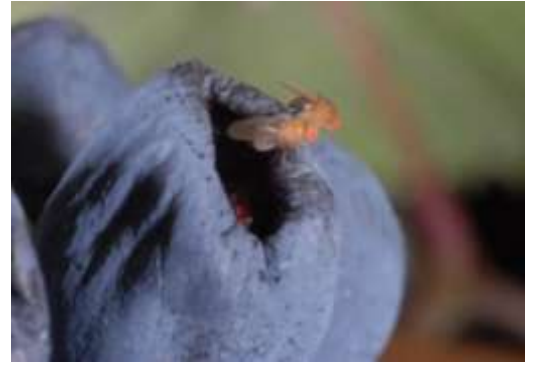
Abb. 1: Vorgeschädigte Beeren werden von Essigfliegen gerne befliegen.