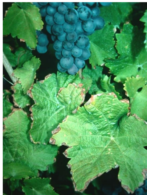
Vertrocknete Blattränder bei Kalimangel.

Die Bodenproben sollen vor einer Grunddüngung aus der Bodenschicht von 0 - 30 cm entnommen werden. Aus 0 - 60 cm Tiefe wird bei Bodenuntersuchung nach der EUF-Methode oder wenn eine tief wendende Bodenbearbeitung geplant ist entnommen. Wenn die Entwicklung der Nährstoffgehalte langfristig beobachtet werden soll, sollte die gleiche Beprobungstiefe beibehalten werden.